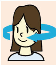
CTは2mm間隔のデータから作ります

花粉症が1年じゅう続いているという人は副鼻腔炎に進行しているかもしれません。アレルギー性鼻炎の薬だけでは治らないので早期診断・治療をおすすめします。