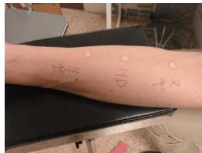
皮膚検査(スクラッチテスト) 皮膚の上にアレルギーのエキスをたらして、赤くなった状態で判定します。数分で判定できますが、皮膚への刺激があるので行えない場合があります。

また、アレルギーのお子さんには中耳炎や副鼻腔炎を起こしやすい傾向があります。アレルギー性鼻炎をコントロールすることで、ほかの病気のリスク管理ができます。