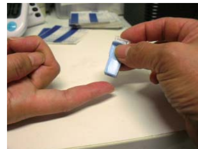
簡易血液検査(イムファストチェック) 指先をつついてにじんだ血液でスギ、ネコ、ダニの3種のアレルギーの程度を調べます。痛みも少なく10分ほどで結果が出るので、小さなお子さんでも安心です。